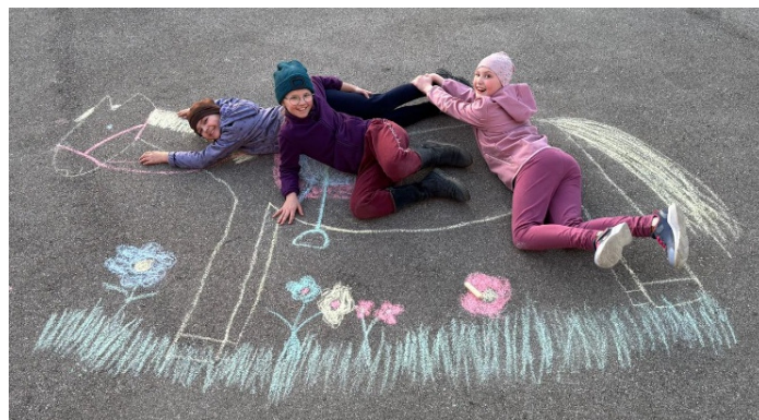
Diese drei Mädels galoppieren über die frühlingshafte Blumenwiese.