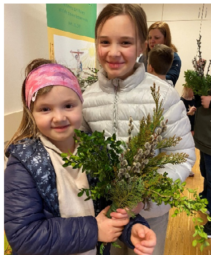
Die fleißigen Jungscharkinder beim Palmbesen- binden

Weil er Gott ist, kann er an vielen Orten gleichzeitig sein.